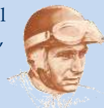
Juan Manuel Fangio